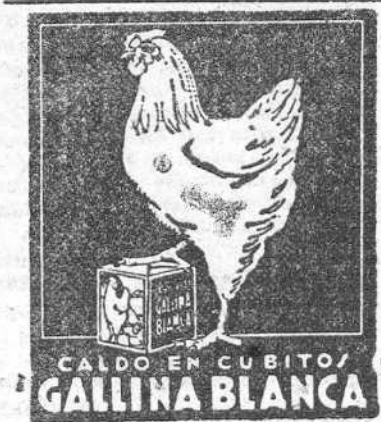
CALDO EN CUBITOS "GALLINA BLANCA"

Nuestra raza, decía muy bien el Caudillo, no sabe de rendiciones ni de retrocesos ni comprende esas sorprendentes entregas de numerosos prisioneros. Y es exacto porque los españoles poseemos —y es esa limpia trayectoria de una concepción histórica a la que felizmente hemos retornado— el sentido exacto de lo que representamos en la concurrencia de los pueblos.