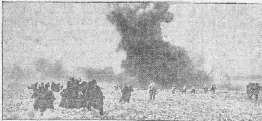
Infantes alemanes vuelven a sus posiciones después de rechazar un ataque bolchevique que han dejado en un tanque incendiado en la refriega.