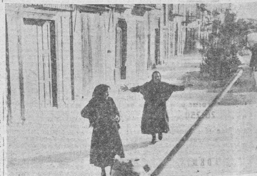
Así recibía el vecindario de Vinaroz a las gloriosas tropas del Caudillo.