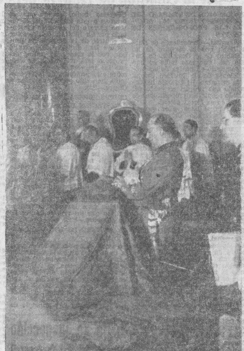
El Generalísimo ofrenda su espada victoriosa en la Iglesia de las Salesas Reales de Madrid.—(Foto Cifra).

Esta abnegación en defensa del cristianismo, se continúa ahora en las etapas heladas de Rusia, donde los combatientes de la División Azul, prosigue con idéntico espíritu, la lucha que en España habían emprendido.