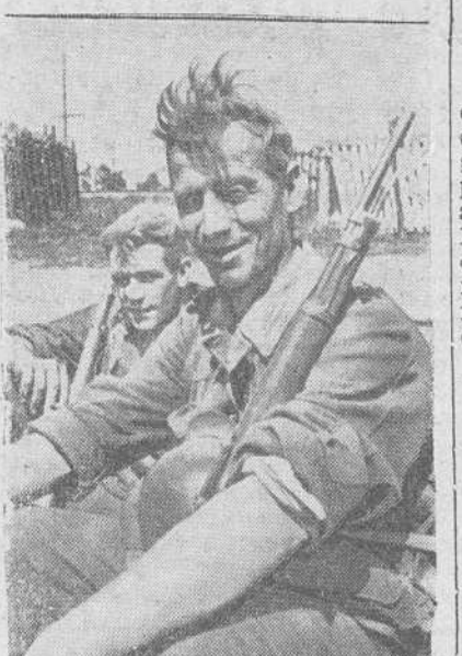
Los soldados alemanes no pierden el buen humor después de un avance prolongado por la región que conduce al Cáucaso