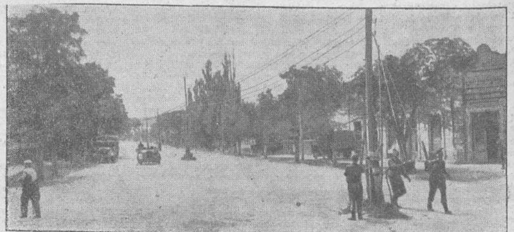
Soldados alemanes reparan las líneas telegráficas de una gran avenida del centro petrolífero de Maikop.