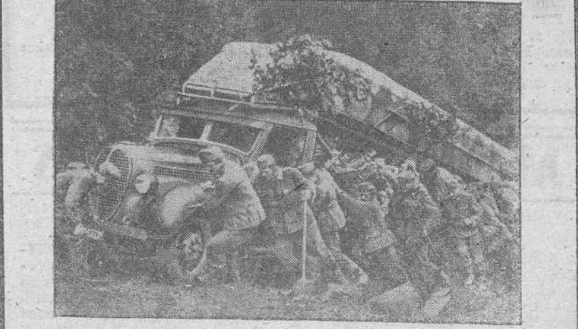
Un paso difícil para los camiones de los soldados húngaros durante su avance en el frente Este.

Los productos que España ha de enviar a Venezuela son los cocimientos a nuestra exportación, adquiriendo en cambio aquellos minerales y productos de la tierra que son la riqueza del país hermano.— Cifra