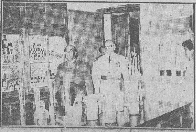
El Pardo. — Un momento de la inauguración por Su Excelencia el Jefe del Estado, a quien acompañaban el ministro de Agricultura y otras personalidades, del nuevo Instituto Forestal de Investigaciones y Experiencias en el Monte de El Pardo.