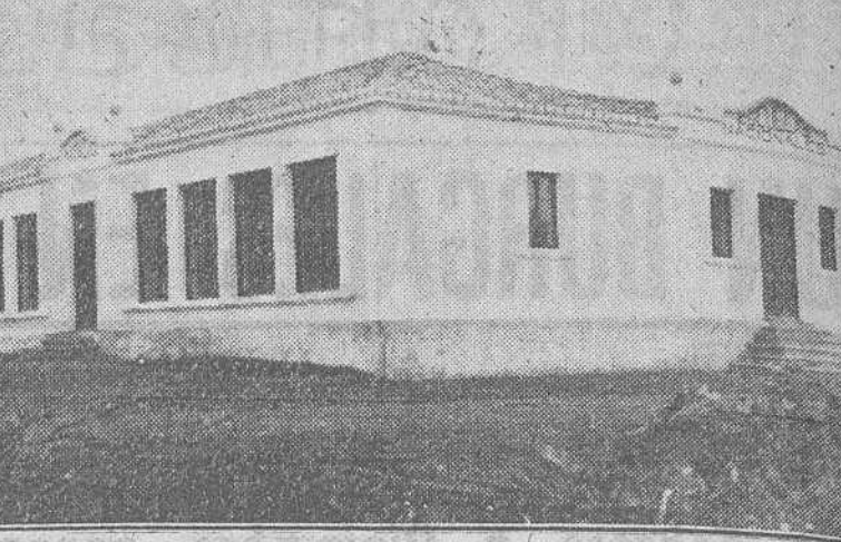
He aquí el soberbio grupo escolar recientemente inaugurado en Cerezo de Riotirón por el gobernador civil de la provincia.