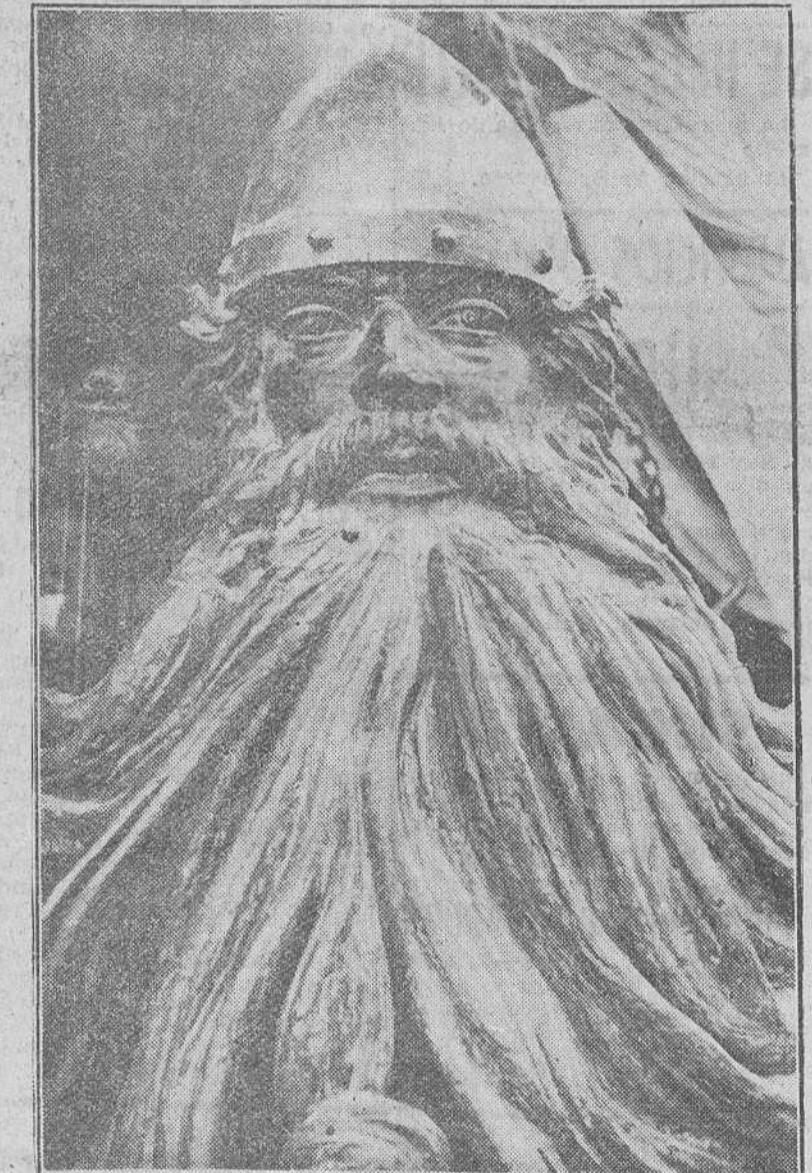
La estatua del mencionado héroe castellano, traída a Burgos el día veintitrés del próximo pasado mes de Octubre, e instalada sobre un pedestal en la plaza del General Primo de Rivera, cuya estatua — encargada, en su día, por el alcalde a la sazón don Carlos Quintana Palacios — ha sido modelada en Madrid por el escultor don Juan Cristóbal y González-Quesada, y fundada en bronce procedente de viejos cañones cedidos por el Ministerio del Ejército, también en Madrid, en los talleres de la Casa Codina Hermanos y el pedestal proyectado por el arquitecto igualmente de la capital de España, don Fernando Chueca y Goitia. Siendo las diecisiete horas, se