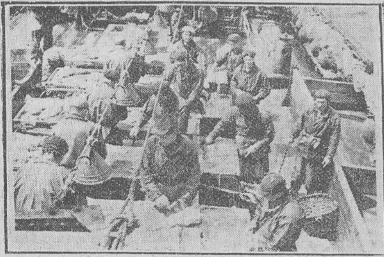
El trabajo a bordo de un bacaladero español. Los hombres que figuran en el ángulo superior son los descabezadores del pescado; los que aparecen en las dos hileras de la izquierda, son los llamados tronchadores; los cuatro de la derecha los lavadores y por último el situado al lado derecho es el cesterero.

Después de virar la red viene el momento álgido del trabajo, organizado de tal modo que no se pierde un minuto. Unos marineros van cortando cabezas, otros abren los bacalao y les cortan las vísceras; otros les cortan la espina dorsal; otros lavan; otro está encargado de llevarlos en cestos a la bodega