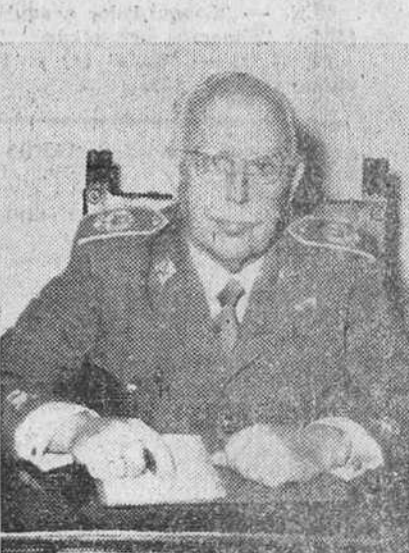
El nuevo general jefe del Estado Mayor de la Sexta región militar y Cuerpo de Ejército de Navarra, excelentísimo señor don José Ysasi-Izasmendi, que se ha posesionado de dicho cargo.