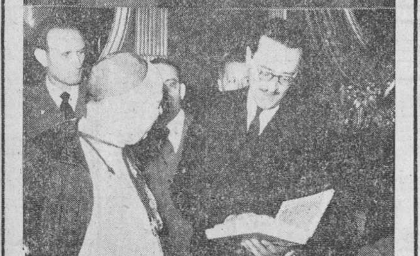
En la mañana de ayer, los componentes de la XIV Semana Social, presididos por el Excmo. Sr. Obispo de Córdoba, fueron objeto de dos recepciones celebradas en la Jefatura provincial del Movimiento y en la Casa Consistorial. A dichos actos pertenecen, por el orden enunciado, las fotografías que reproducimos.

(En cuarta página amolla información de la Semana Social)