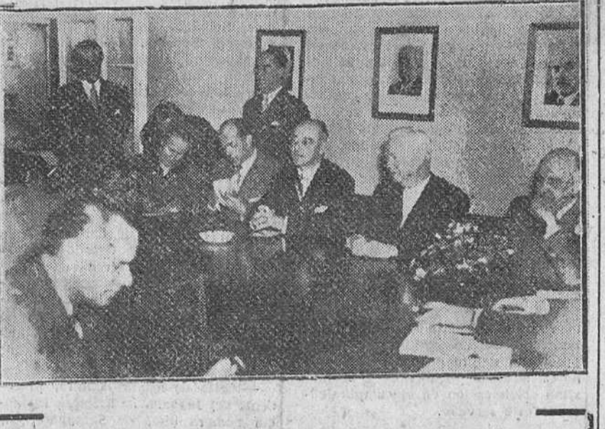
Bonn. — El ministro español de Agricultura, don Rafael Cavestany, que se encuentra en viaje oficial en la Alemania Occidental...