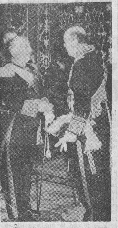
Madrid. — S. F. el Jefe del Estado conversando con el nuevo embajador de Portugal, don José Nascimim, durante la ceremonia de presentación de credenciales del diplomático lusitano, celebrada en el palacio de Oriente.

Presentación de credenciales del embajador portugués