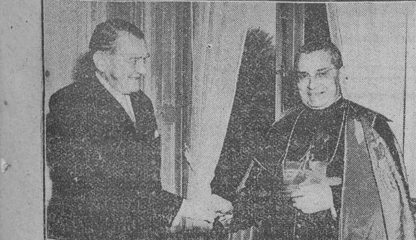
París. — El Cardenal Arzobispo de Tarragona, monseñor De Arriba y Castro, saluda al presidente de la República francesa, René Coty, con motivo de la visita oficial efectuada por el prelado español.