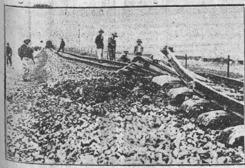
Actualmente se desarrolla entre Hanoi y Haifong una áspera lucha, para garantizar la seguridad de las vías de comunicación entre las dos ciudades. Un aspecto de la vía después de un saqueo de las tropas del Vietnam.