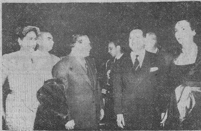
La Habana.—El presidente de Cuba, general Batista, acompañado de su esposa, el embajador de España y la marquesa de Vellisca y otras personalidades, en el acto de inauguración del nuevo edificio para la Embajada de España en Cuba.