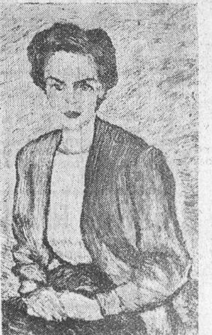
Retrato de la señora de G. Camiñas, obra de Modesto Ciruelos y fiel exponente del arte expresionista que el notable pintor burgalés cultiva con indudable éxito.