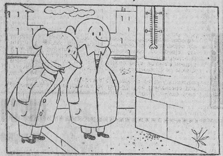
Le han puesto demasiado alto.