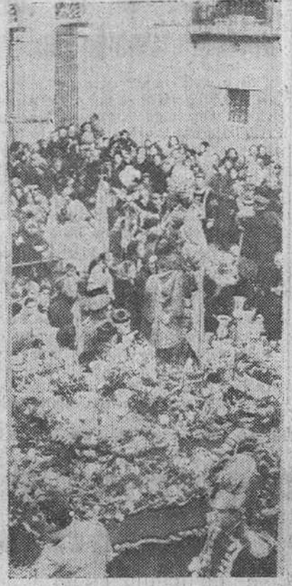
Madrid.—Con motivo del Año Mariano, la imagen de la Virgen de la Almudena ha sido trasladada al altar mayor de la Catedral. La "foto" muestra el momento en que la brillante comitiva sale del templo de la Almudena.