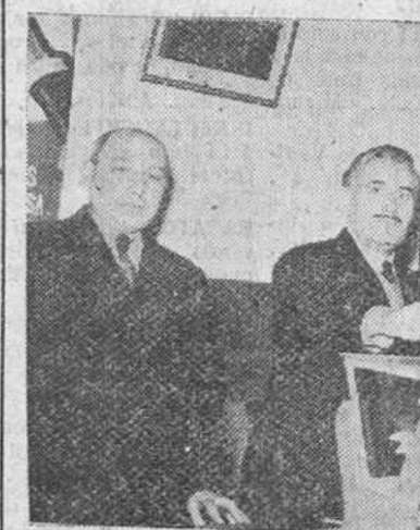
Uno de los empleados de la RENFE en nuestra ciudad, emitiendo su voto, en las elecciones celebradas ayer para jurados de empresa.