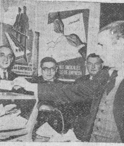
Uno de los empleados de la RENFE en nuestra ciudad, emitiendo su voto, en las elecciones celebradas ayer para jurados de empresa.