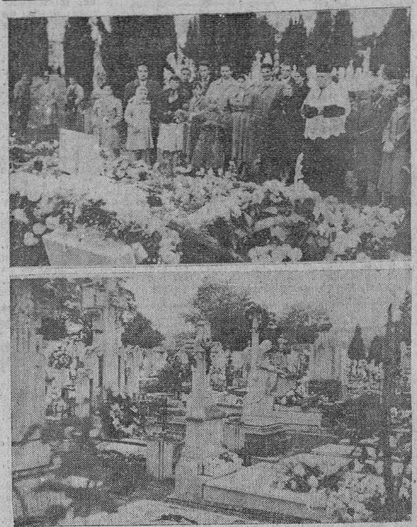
Como es tradicional, ayer fueron numerosísimos los fieles que durante todo el día acudieron al camposanto municipal de San José, para rezar y depositar flores ante las tumbas y panteones de sus seres queridos. En la parte superior aparece un grupo de personas, rodeando al capellán de los establecimientos municipales de Beneficencia, mientras se rezaba un responso por el eterno descanso de los muchachos que murieron trágicamente en la "Curva del Diablo". En segundo término, aspecto de uno de los patios de la necrópolis.