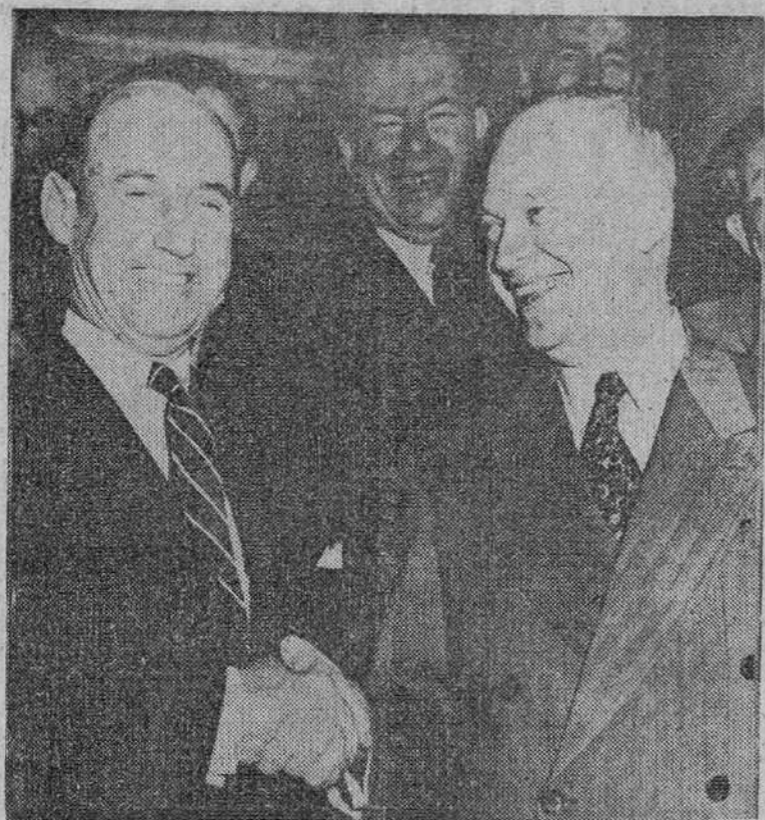
Concluidas las elecciones presidenciales de 1952, los dos rivales políticos, Stevenson y Eisenhower, se estrecharon amigablemente las manos, después del triunfo republicano.

Los hombres, un general retirado y un intelectual aburrido, están corriendo el maratón político de mayor trascendencia mundial. Eisenhower y Stevenson avanzan hacia la meta fijada para el 8 de Noviembre: La Presidencia. Ambos están viviendo estos días, por segunda vez, la experiencia más fatigante de su vida. La campaña electoral está ya tocando a su fin, un fin que forzosamente ha de ser desconsolador para uno de los dos candidatos. Muy en breve cesarán los gritos de "I like Ike" y los de "We went Adlai", los dos candidatos descansarán del extenuante barullo y presión electorales. Se acallarán los telegráficos, las voces de los policías dando órdenes, el ruido de los motores de avión, las llamadas telefónicas, los discursos. No más apretones de mano, no más sonrisas a diestra y siniestra, no más promesas al pueblo. El destino de la nación más fuerte y poderosa de la tierra tendrá ya su forjador y su intérprete para los años venideros.