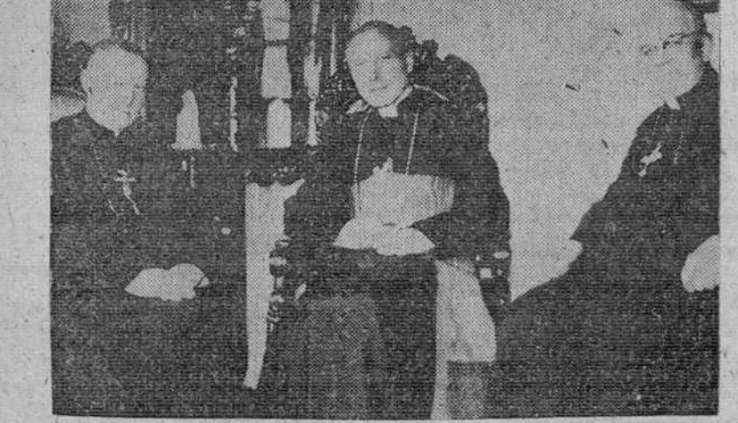
Varsovia. — El cardenal Stefan Wyszyński, Prímado de Polonia, puesto en libertad por el Gobierno Gómulka de su destierro en un monasterio de los Cárpatos, fotografiado por primera vez junto a los obispos Klepacz (izquierda) y Choromanski (derecha).