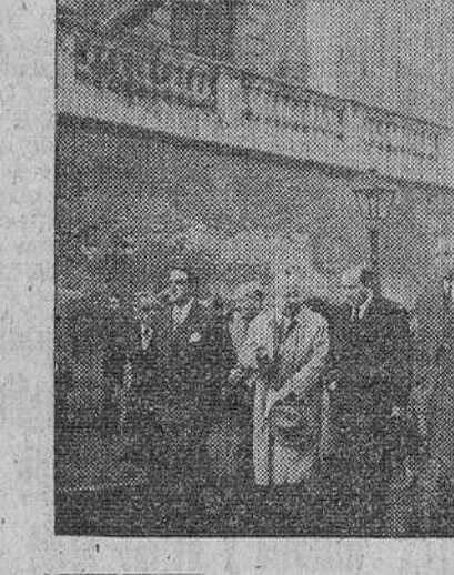
Madrid. — El ministro de Educación Nacional y los parientes del finado en la presidencia del duelo, con motivo del entierro del ilustre escritor don Pío Baroja.