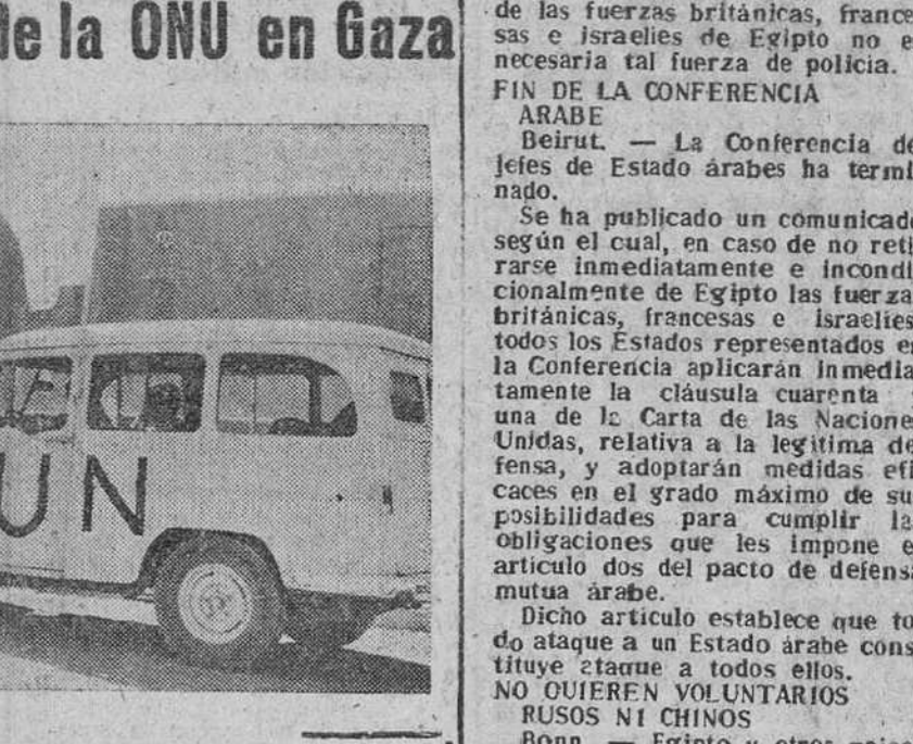
Gaza.—Un automóvil furgoneta, al servicio de la ONU y con una bandera blanca, parado frente al cuartel general israelí en Gaza, en la península de Sinaí, conquistado por dichas tropas en su avance en territorio egipcio.—(Foto Cifra)