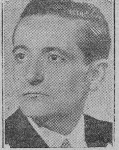
Serán también anunciado, anoche, a las diez, y clausurada en la Sala Municipal de Arte la exposición de pintura del gran pintor burgalés Modesto Ciruelos, figura bien conocida en nuestra ciudad y en el ambiente internacional y que, de nuevo, ha obtenido un gran éxito con esta exposición.

Modesto Ciruelos clausuró anoche su interesante exposición