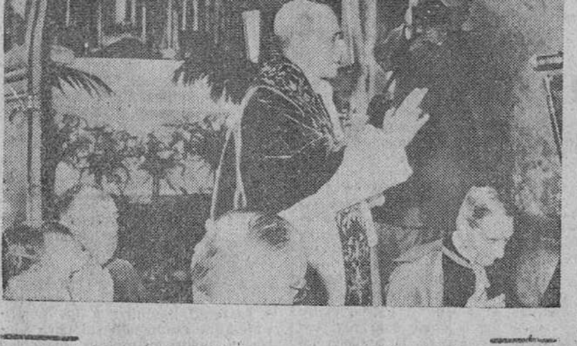
Ciudad del Vaticano.—S. S. el Papa en el momento de bendecir el automovil-capilla destinado a los católicos húngaros refugiados en Austria y que se albergan en las proximidades de su país.

EL SANTO PADRE BENDICE LA CAPILLA VOLANTE CON DESTINO A LOS REFUGIADOS HUNGAROS EN AUSTRIA