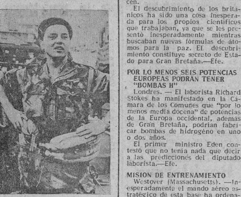
Los oficiales de la base se negaron a facilitar detalles, limitándose a decir que dicha orden "procedía de la superioridad".

Más fotógrafos muertos en el cumplimiento de su deber informativo