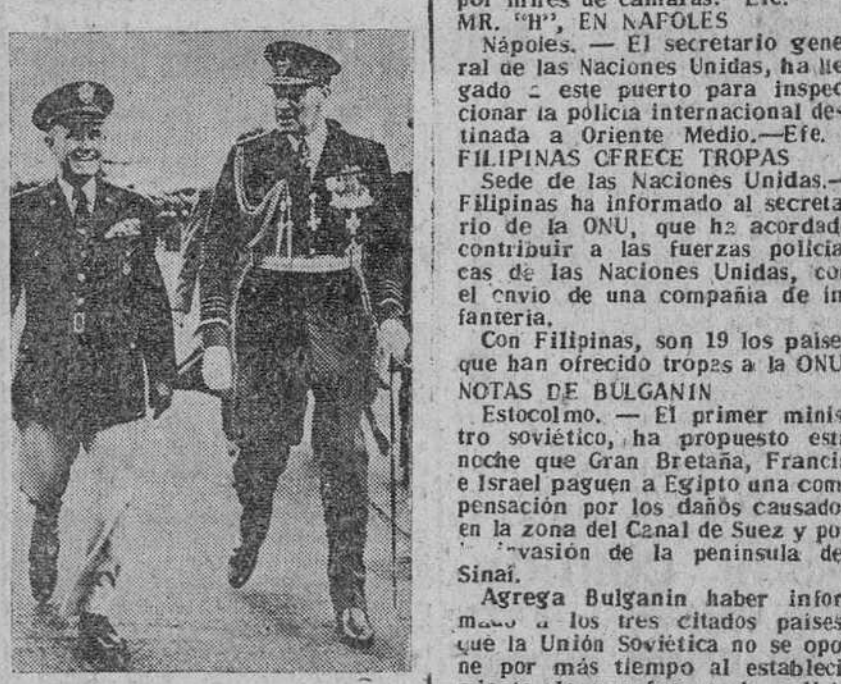
El general Gruenther (a la izquierda), que hasta hace poco era el comandante supremo aliado de las fuerzas de la N. A. T. O. en Europa, acompañado del mariscal de la RAF, Hermet Boyle, jefe del Estado Mayor del Aire británico, a su llegada al aeropuerto de Londres, en visita de despedida a la Gran Bretaña antes de regresar a los Estados Unidos.