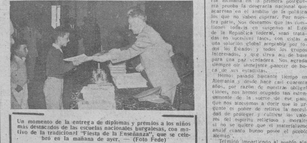
Un momento de la entrega de diplomas y premios a los niños más destacados de las escuelas nacionales burgalesas, con motivo de la tradicional "Fiesta de la Enseñanza", que se celebró en la mañana de ayer.