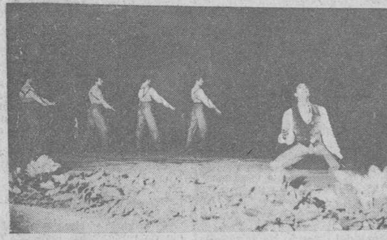
Granada.— "La muerte de Antonio Cambario por sus cuatro primos Heredia", famoso poema gitano de García Lorca, ha sido representado en estreno por el famoso bailarín Antonio y su ballet, en las sesiones de clausura del Festival de Música y Danza, que se ha venido celebrando en Granada.