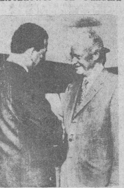
Ciudad de Panamá.— El presidente norteamericano, Eisenhower recibe la bienvenida del presidente Arias de Panamá a su llegada al aeropuerto de la ciudad para tomar parte en la reunión de presidentes americanos celebrada estos días.