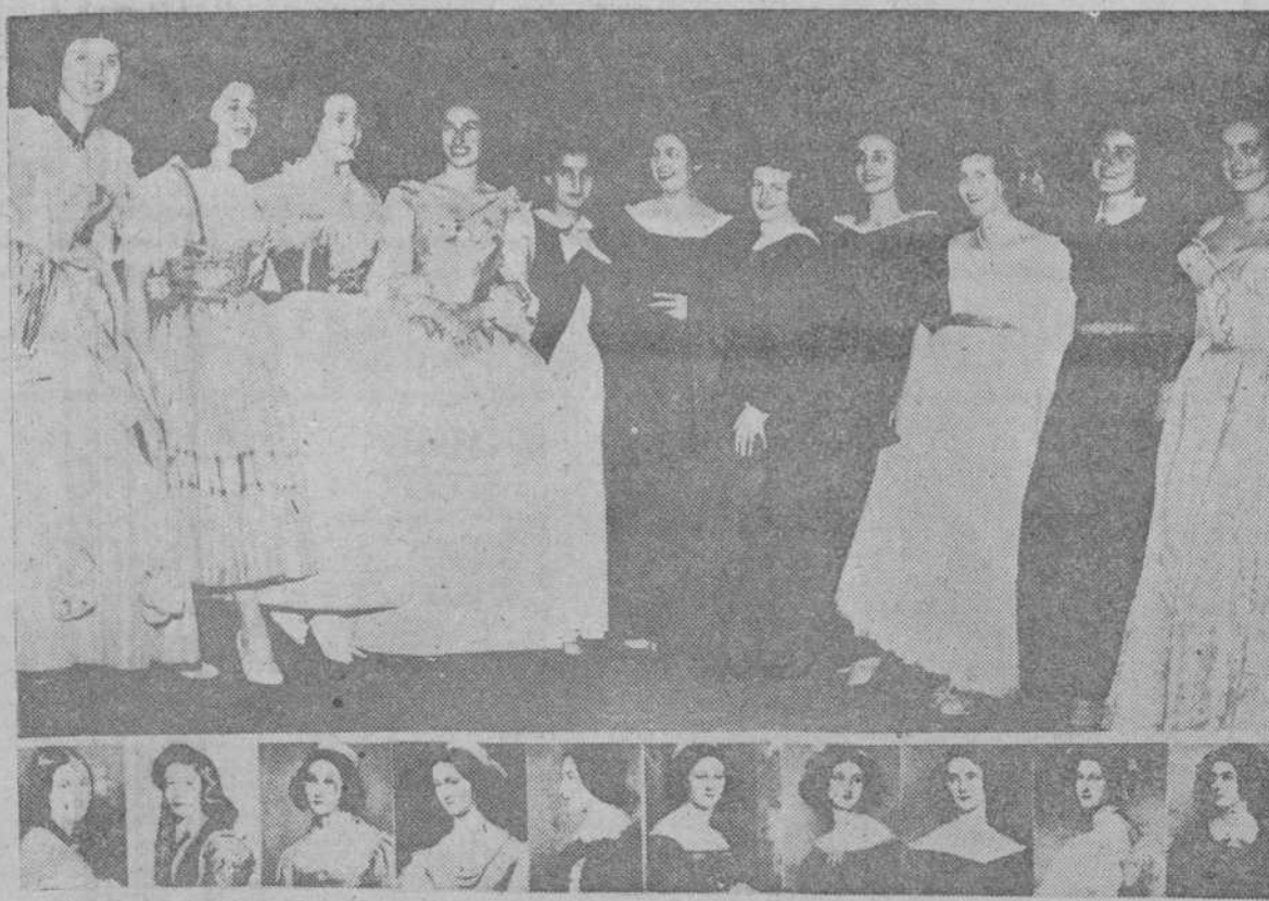
Francfort. La galería de famosos retratos de bellezas, del Rey de Baviera Luis I, ha servido a los modistos y peluqueros actuales de inspiración para un concurso de modas en el que se reproducían las imágenes pictóricas. En la foto, las vencedoras del original concurso y abajo, los retratos que las inspiraron.