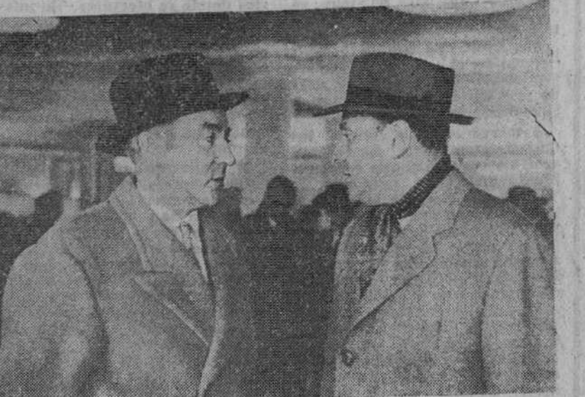
Madrid. — Don José María Areilza, embajador de España en Washington, fotografiado en el aeropuerto de Barajas, a su llegada a Madrid procedente de Washington.