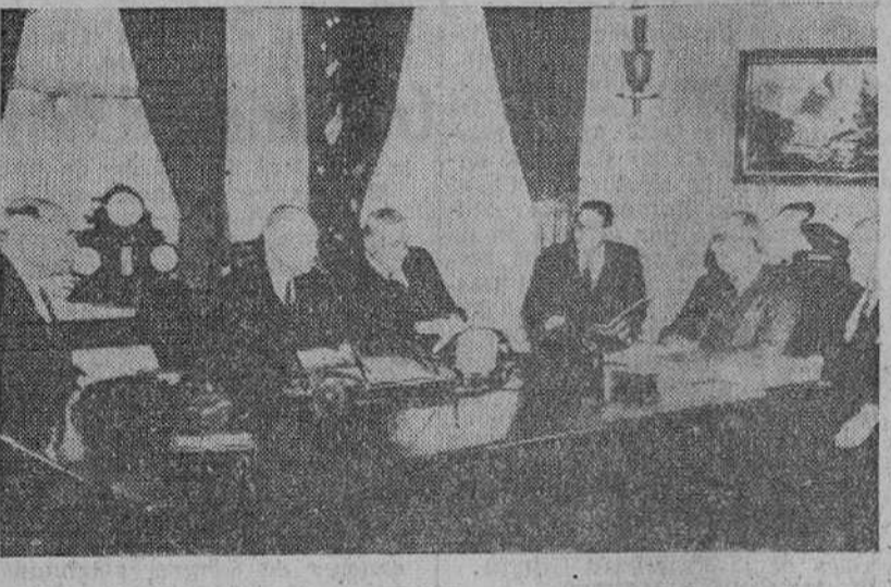
Washington. — El presidente Eisenhower y el secretario de Estado, Foster Dulles, acompañados de otras personalidades durante la reunión celebrada ante cinco asesores para dar más actividad a su programa de átomos para la paz.