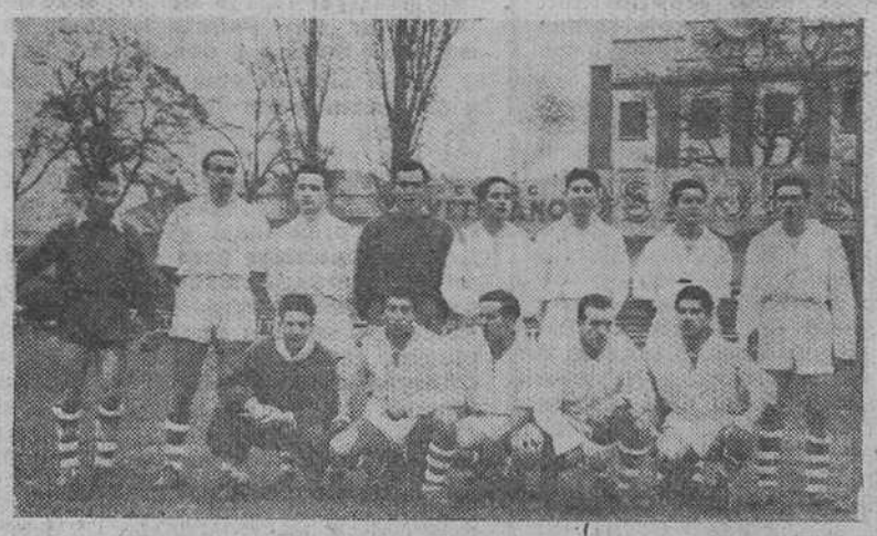
El Deportivo Juventud, que tan excelente campaña ha realizado en el curso de la presente temporada, culminada con el ascenso a Tercera División

Actualmente tiene un déficit de 45.850 pesetas.- "Seguiremos cultivando la cantera local, con algún injerto".- Nuestro objetivo es mantenernos en categoría nacional.- Se preparan actos para festejar el ascenso