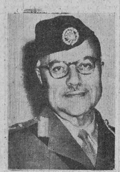
Amman.—El general Radi Innaz, adjunto del jefe del Estado Mayor del Ejército de Jordania, que ha sido designado para desempeñar la Jefatura de la Legión Árabe en sustitución del destituido general inglés Glubb Bajá.