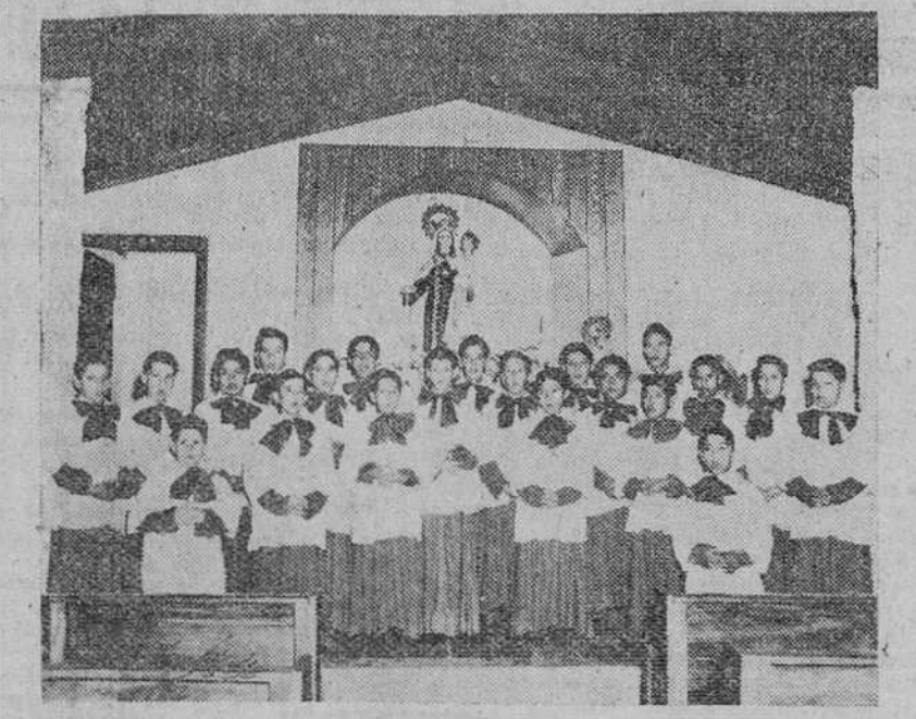
He aquí a los componentes del magnífico Orfeon Infantil Mexicano, que esta tarde dará un concierto en el Teatro Avenida, audición organizada por el Aula de Música de la Asociación Cultural Iberoamericana