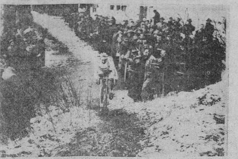
LUXEMBURGO. — El corredor francés Andre Dufráisse durante la prueba valedora para el Campeonato del Mundo de Ciclo-cross que ha ganado por tercera vez consecutiva. La carrera se celebró en el bosque de Bambush sobre una distancia de 24,300 kilómetros, en los que Dufráisse tardó en recorrer una hora, 25 minutos y 2 segundos.