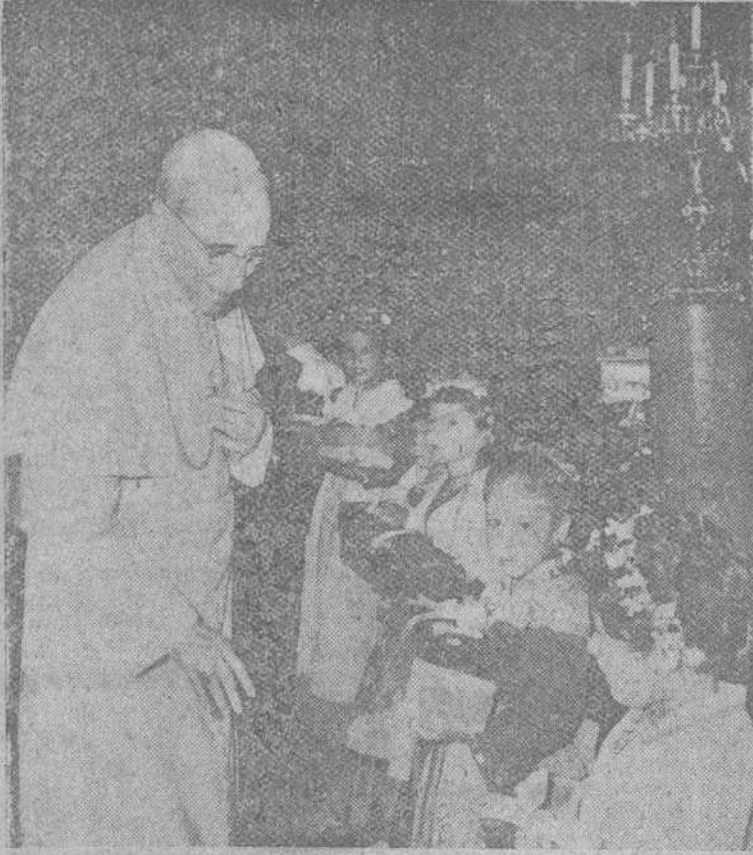
Castelgandolfo. — Su Santidad el Papa Pío XII, recibe de estas niñas, ataviadas con trajes típicos de la región, una selección de exquisitos melocotones de la provincia con motivo de la tradicional fiesta de los melocotones de Castelgandolfo, localidad donde está situada la residencia de verano del Sumo Pontífice.—(Foto Cifra)