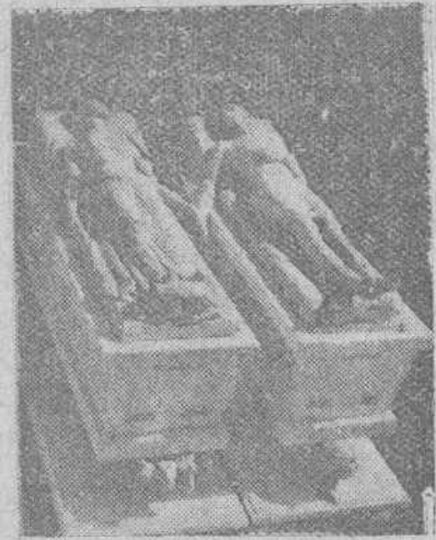
Maqueta del Mausoleo a los Amantes de Teruel, del insigne escultor Juan Avelos, autor del Valle de los Caídos en Cuelgamuros y que será erigido en la iglesia de San Pedro, de Teruel, con la aportación de todos los novios de España y de cuantas personas crean en el Amor.