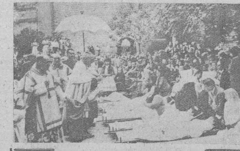
Barcelona. — En la Parroquia de Santa Ana de Barcelona, donde se venera la imagen de la Virgen de Siracusa y con motivo de celebrarse ahora el aniversario en que derraman lágrimas, como gran milagro, se efectuó la solemne bendición de enfermos en los jardines y claustro de este templo, que revistió emocionante solemnidad.