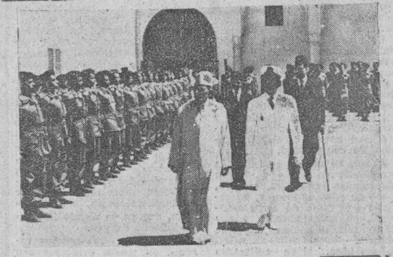
Rabat. — S. M. I. el Sultán de Marruecos, acompañado del príncipe heredero y de otras personalidades de su Gobierno, revista a los cadetes marroquíes de la antigua zona española que cursarán sus estudios en las Academias militares de España. La revista se celebró en el Patio de Audiencias del Mechuar de esta ciudad.