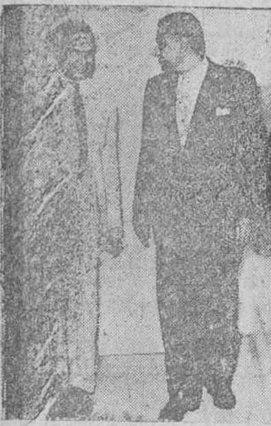
Krisna Menon (a la izquierda) que representó a la India en la Conferencia de Londres sobre el Canal de Suez, se entrevista en El Cairo con el presidente egipcio, coronel Nasser.

Aunque Egipto no ha presentado oficialmente contraproposiciones admitiría el control por la ONU de la libertad de paso por el Canal