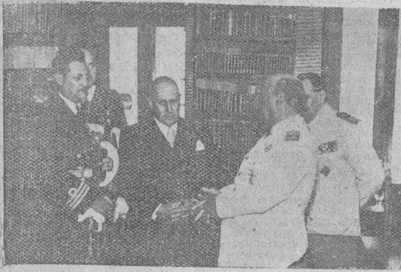
La Corona. — Un momento de la audiencia concedida por Su Excelencia el Jefe del Estado a los marineros de la división naval colombiana, llegada al puerto de El Ferrol del Caudillo.