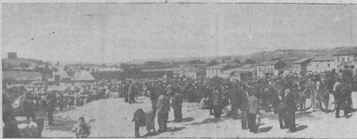
PANORAMICA DEL MERCADO DURANTE LAS FAMOSAS FERIAS DE SAN MATEO.

SERAFIN SEBASTIAN TALLER DE GUARNICIONERIA Y CORDELERIA Calle San Vicente y calle del Arco PAMPLIEGA