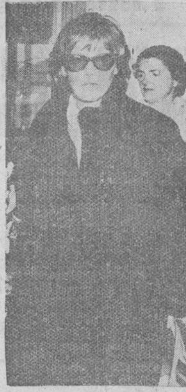
Paris. — Desde hace algún tiempo, casi todas las fotografías que los reporteros chilenos de Greta Garbo muestran a esta singular actriz como una sombra huidiza, que no dejaba ver su cara, ya algo ajada, tapada con unos sombreros quizá algo estrafalarios. En la presente ocasión el fotógrafo ha tenido más suerte y aquí aparece ante Vds. a cara descubierta, con unas gafas de sol a su llegada al aeropuerto de Orly, procedente de Niza, camino de Norteamérica.