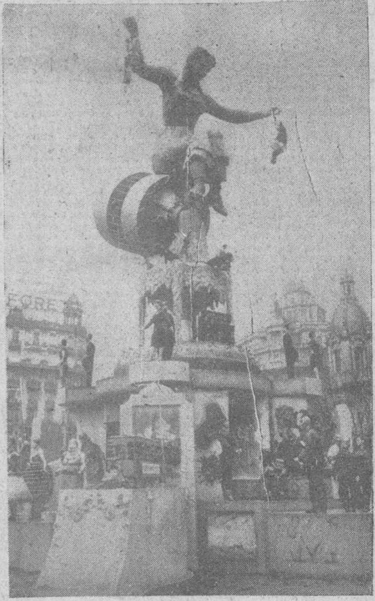
Valencia.— Falla levantada en la Plaza del Generalísimo, obra del artista Vicente Pallardo.