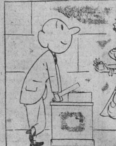
—Lo quería más caro. —Muy bien; déme cien pesetas más.