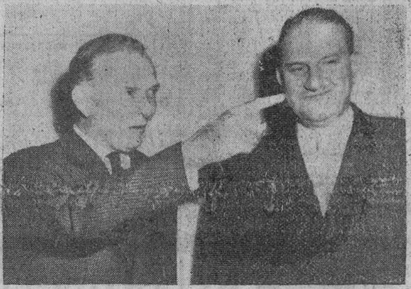
Entrevista de los ministros español y británico de Asuntos Exteriores en Londres