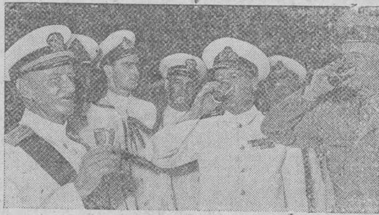
El momento del brindis en un acto celebrado en honor del almirante Nimitz (que aparece en primer lugar, a la derecha), con motivo de su nombramiento de Caballero de la Cruz del Baño, la más alta condecoración del Imperio británico