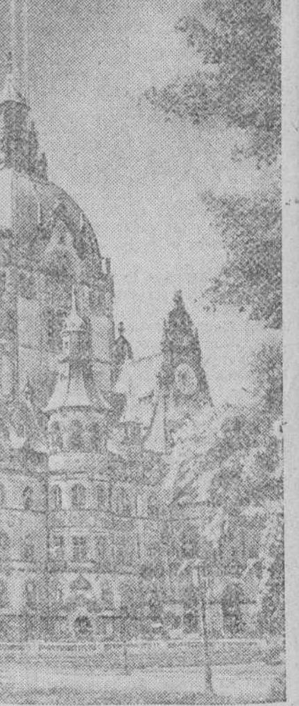
El Ayuntamiento de Hannover, convertido ahora en la sede del cuartel general del Gobierno militar aliado para Alemania