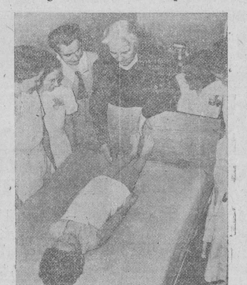
La hermana Elisabeth Kenny explicando sus famosos métodos para el tratamiento de la parálisis infantil, mediante la aplicación de fomentos calientes y movimiento de los músculos en lugar de la práctica tradicional de tablillas y moldes