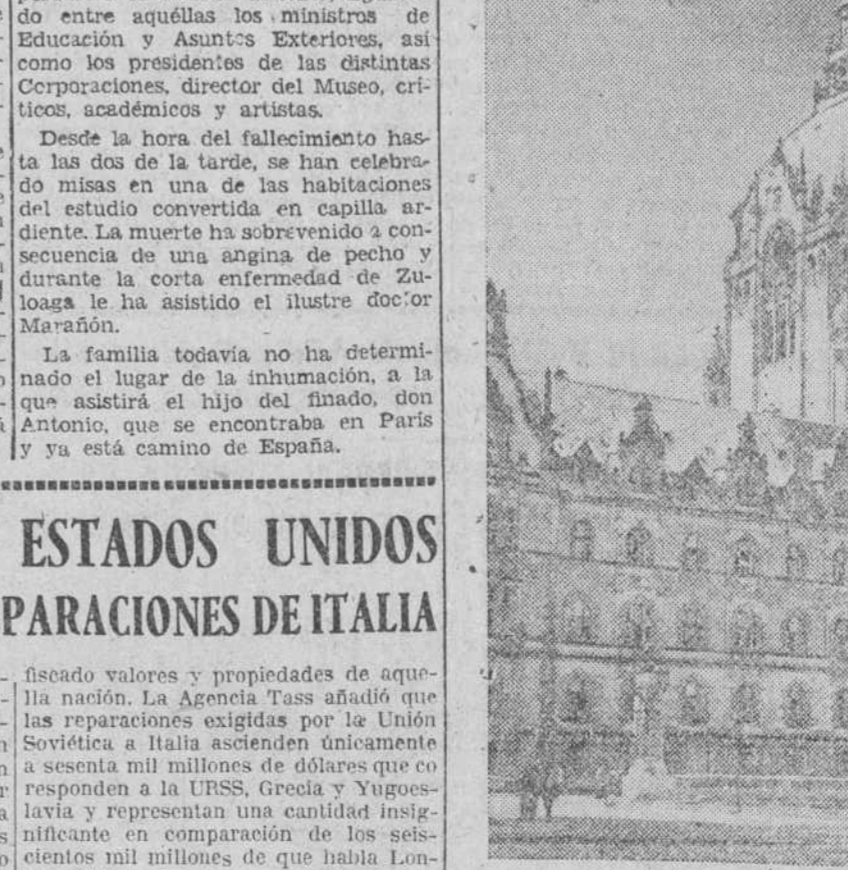
El Ayuntamiento de Hannover, convertido ahora en la sede del cuartel general del Gobierno militar aliado para Alemania