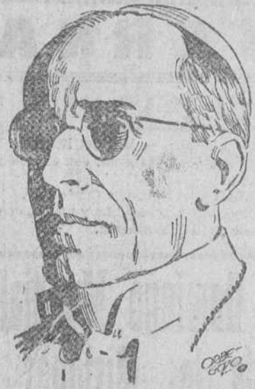
Ciudad del Vaticano.—Su Santidad el Papa recibió el domingo, en el salón de honoraciones del Palacio del Vaticano, a tres mil mujeres de Acción Católica, a las cuales dirigió una alocución en la que, entre otras cosas, dijo:

Discurso del Sumo Pontífice ante 3.000 mujeres de Acción Católica