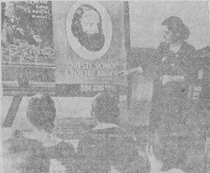
Los niños de una escuela de una ciudad italiana, contemplan el retrato de Giuseppe Garibaldi.