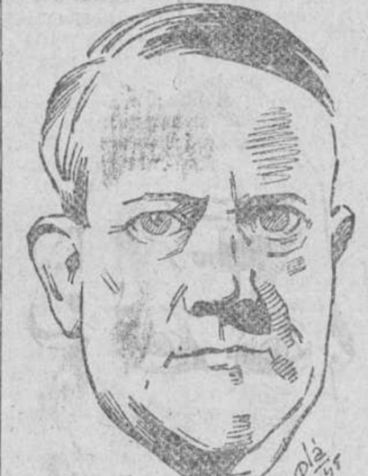
Oslo.—Vidkun Quisling, el ex jefe del Gobierno noruego bajo la ocupación alemana, ha solicitado el indulto, según anuncia la Agencia telegráfica noruega.

¿Cabe mayor y más auténtica democracia, repetimos? En franca contraposición casi el resto del Mundo, España, en los cinco años últimos, ha desarrollado una línea que la acerca a una modalidad de gobierno que, además de encajar admirable y exactamente en ella misma terminará por conseguir el respeto de todos y la admiración a lo menos, de muchos.