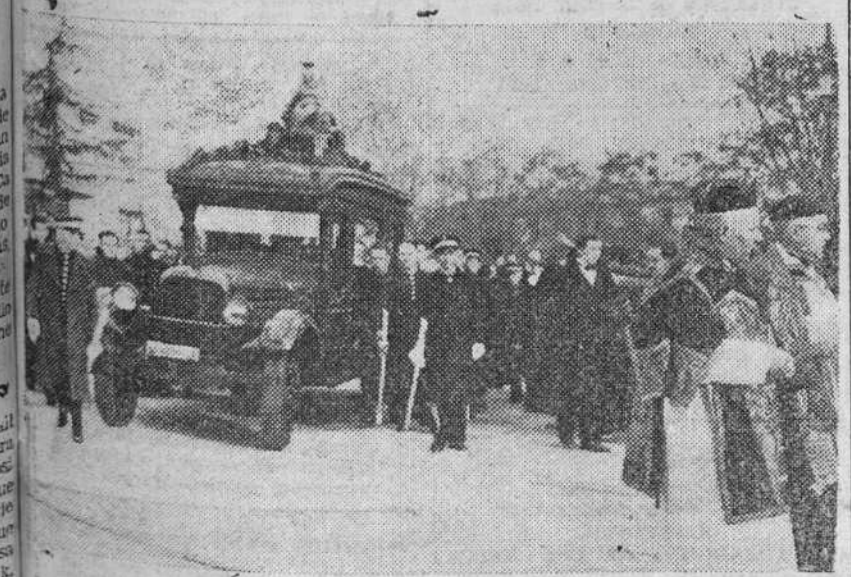
El cortejo fúnebre a su paso por las calles de Madrid