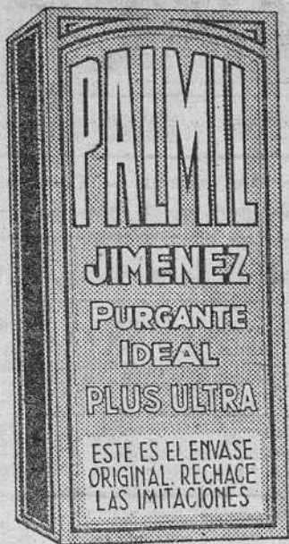
(C. C. S. n.º 28)

En TODAS LAS FARMACIAS tienen existencias de