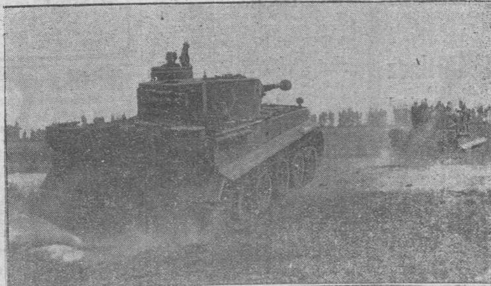
Los nuevos tanques alemanes que salen constantemente de las fábricas son sometidos a diversas pruebas de funcionamiento, como nos muestra la foto, antes de su salida para las líneas de combate