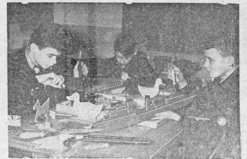
Miembros de la Juventud Hitleriana preparan juguetes para los hijos de los soldados