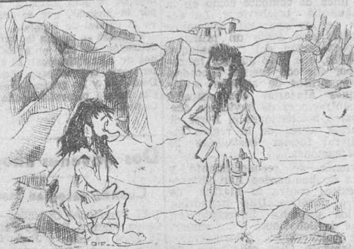
EN LA EDAD DE PIEDRA

ULTIMO MODELO LA LLAVE DEL ETER BATTANER - MONEDA. 14