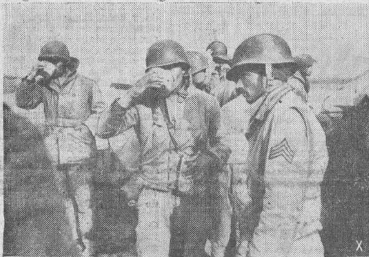
Prisioneros norteamericanos, apresados por los alemanes en el frente de Túnez, mitigan ansiosamente su sed, después de la batalla que trajo como consecuencia su cautiverio