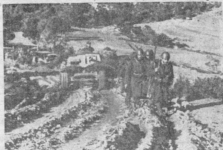
Infantería italiana y tanques alemanes se dirigen a la línea de fuego en el sector de Túnez