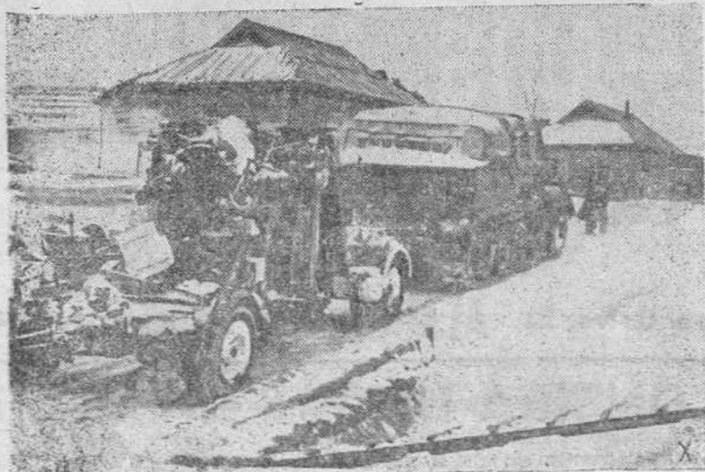
Las baterías de la D. C. A. prestan un valioso servicio en las operaciones en el frente del Este. Aquí vemos a una pieza antiaérea en marcha al sector de operaciones