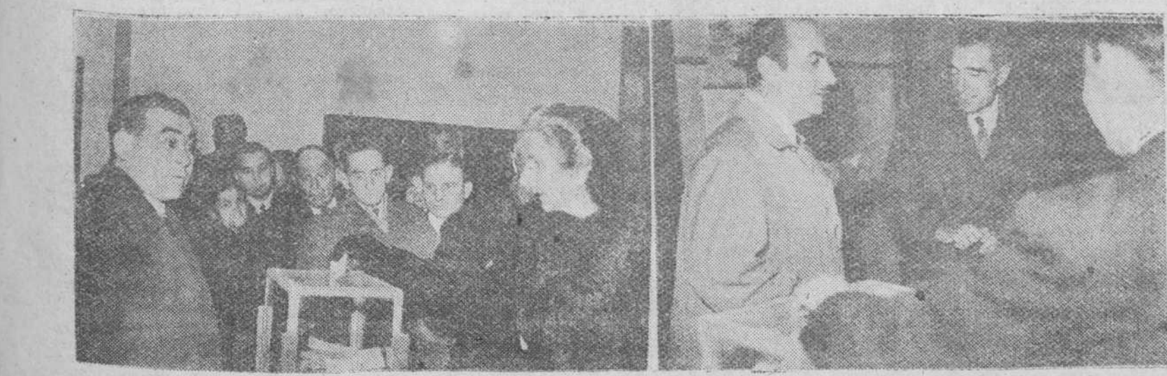
Dos documentos gráficos de las elecciones celebradas el pasado domingo en nuestra ciudad, para la elección de representantes del tercio de cabezas de familia. A la izquierda una de las colas formadas ante las urnas electorales. A la derecha, el excelentísimo señor gobernador civil y jefe provincial del Movimiento, presenciando las operaciones de la elección, en uno de los colegios.