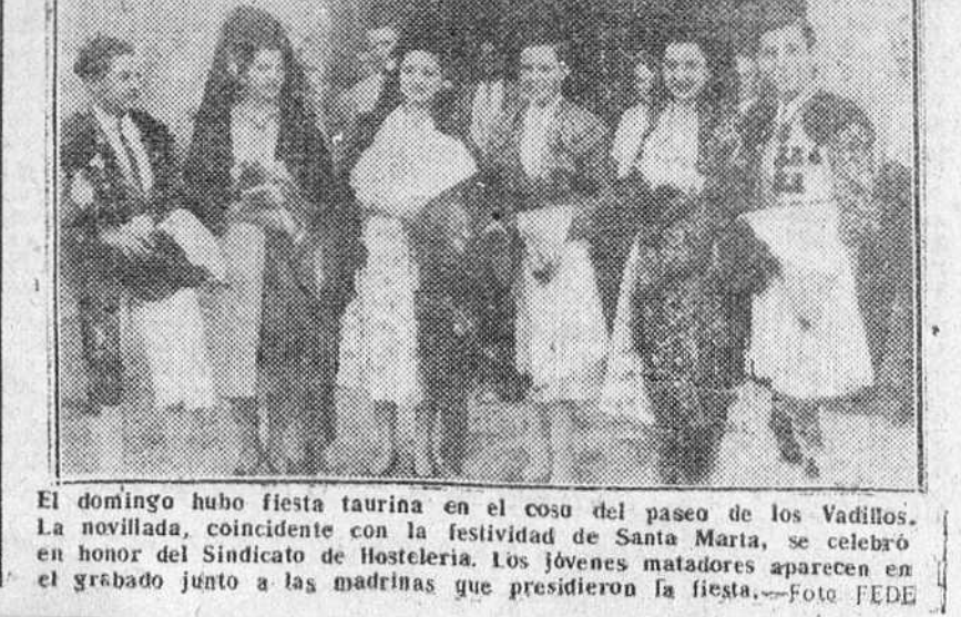
El domingo hubo fiesta taurina en el coso del paseo de los Vadiños. La novillada, coincidente con la festividad de Santa María, se celebró en honor del Sindicato de Hostelería. Los jóvenes matadores aparecen en el grabado junto a las madrinras que presidieron la fiesta.