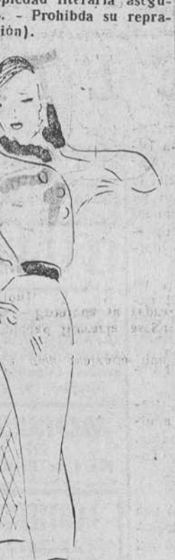
Vestido de paño gris forrado de escocés verde y rojo. (Creación Bruyere)

(Propiedad literaria asegurada. - Prohibida su reproducción.)