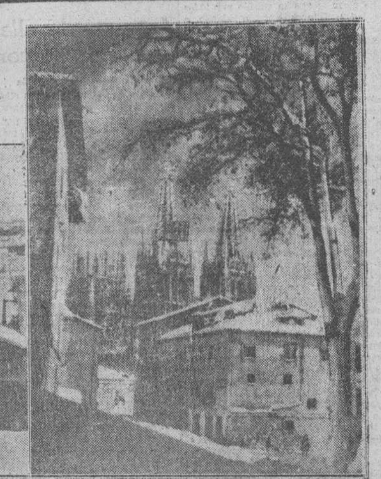
La ciudad amaneció el domingo totalmente cubierta por una espesa capa de nieve, como puede apreciarse en estas bellas fotografías captadas por el objetivo de "FeDe".

Hubo misas, actos literarios y banquetes de hermandad. En Madrid, coincidiendo con esta fecha, se celebró el "Día del periodista caído".