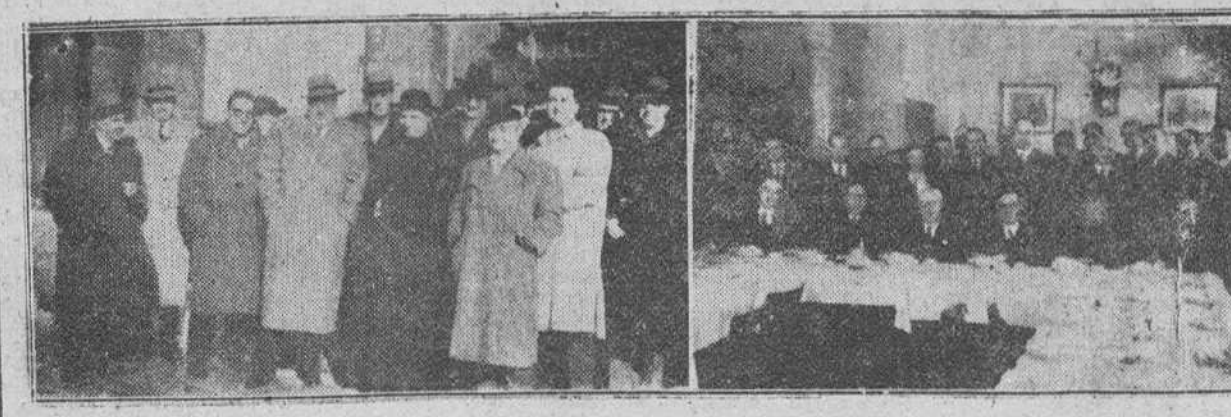
EL DOMINGO SOLEMNIZARON LOS PERIODISTAS BURGALÉSES LA FESTIVIDAD DE SU PATRONO SAN FRANCISCO DE SALES. EN LAS PRECEDENTES FOTOGRAFIAS OFRECIMOS DOS DOCUMENTOS GRAFICOS DE LOS ACTOS CELEBRADOS. A LA IZQUIERDA, LAS PRIMERAS AUTORIDADES BURGALÉSES, ACOMPAÑADAS DE VARIOS PERIODISTAS Y COLABORADORES DE LA PRENSA A LA SALIDA DEL SANTO TEMPLO CATEDRAL, DONDE ASISTIERON A UNA SOLEMNE MISA, A LA DERECHA, PRESIDENCIA DEL BANQUETE DE CONFRATERNIDAD CELEBRADO A MEDIODÍA EN EL RESTAURANTE "ARRIAGA".