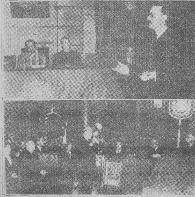
El Ayuntamiento entregó ayer en un acto de gran solemnidad el título de hijo adoptivo de Burgos al excelentísimo señor don Ramón Menéndez Pidal. A tan señalado acontecimiento se refiere el precedente grabado que reproduce tres momentos de la ceremonia. En primer término aparece el alcalde acompañando al homenajeado al hacer su entrada en la Sala de Jueces. A continuación, el señor Díaz Reig, haciendo la ofrenda del título y, por último, el ilustre presidente de la Real Academia de la Lengua contestando al alcalde de la ciudad.