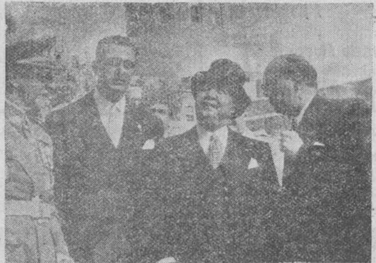
Madrid. El excelentísimo señor don Elpidio Quirino, Presidente de Filipinas, contempla uno de los edificios del Consejo Superior de Investigaciones Científicas, acompañado del Presidente del Consejo de Estado, señor Ibañez Martín y del ministro de Educación Nacional señor Ruiz Jimenez.

Por la tarde, regresará, desde El Escorial, a Madrid, donde asistirá a un vino de honor ofrecido por el embajador de Filipinas.