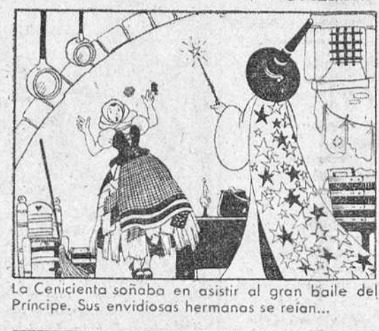
La Centienta soñaba en asistir al gran baile del Principe. Sus envidiosas hermanas se reían...

CONTADAS POR MARIA ARTIACH ¡La galleta María Artiach! ¡Siempre la misma! María de veras. No solo redonda, sino la calidad y la gustosidad máximas. Mantecosa, crujiente y finísima. La componen leche fresca, mantequilla, flor de harina y blanco azúcar. Altamente digestiva y nutritiva. Sola o acompañada, apeete a todas horas. 1/2 y 1/4 LATA. PAQS. DE 100 Y 200 G. Adquiera las galletas en envases completos.