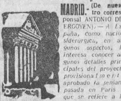
MADRID.—(De nuestro corresponsal ANTONIO DE ERGOYEN).—A España, como nación siderúrgica, en algunos aspectos, le interesa conocer algunos detalles principales del proyecto provisional que se aprobó la semana pasada en París y que se refiere a la puesta en vigor de un tratado sobre el Plan Schuman, en el que hasta el momento figuran seis países europeos.

El cuarto estreno de Benavente en la presente temporada