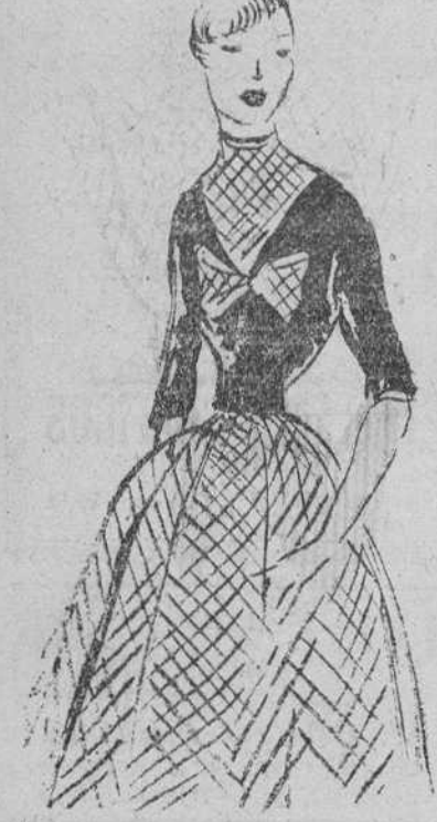
Vestido de tafetán escocés con cuerpo azul oscuro (Creación Heim)

piques, hasta el nuevo delphin de la moda, el joven inglés Awwyn, que parecía que iba a hacer algo sensacional, ninguno ha tenido la idea "bomba" que todo el mundo esperaba con curiosidad. Verdad es que tampoco es tan fácil y que bueno es que la moda cambie su ritmo precipitado para adquirir una más tranquila que nos permita, por lo menos, leer los vestidos que tan caros cuestan.