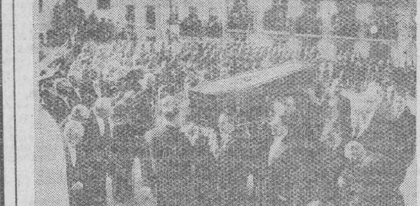
Lisboa.—El féretro que contiene los restos mortales de la Reina Amelia de Portugal a su llegada al panteón de San Vicente, donde recibió cristiana sepultura.