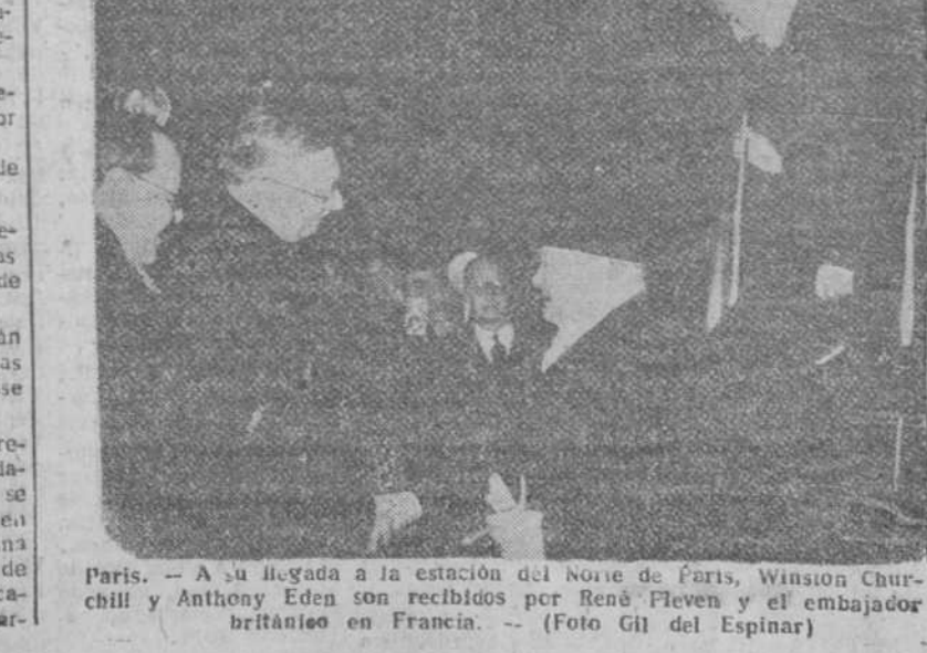
Paris. — A su llegada a la estación del Norte de París, Winston Churchill y Anthony Eden son recibidos por René Pleven y el embajador británico en Francia.