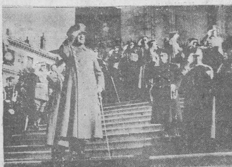
Madrid.—El ministro del Ejército, general Muñoz Grandes, con otras jerarquías, a la salida de la iglesia de los Jerónimos donde se celebró la festividad de Santa Bárbara. Patrón de los Artilleros.