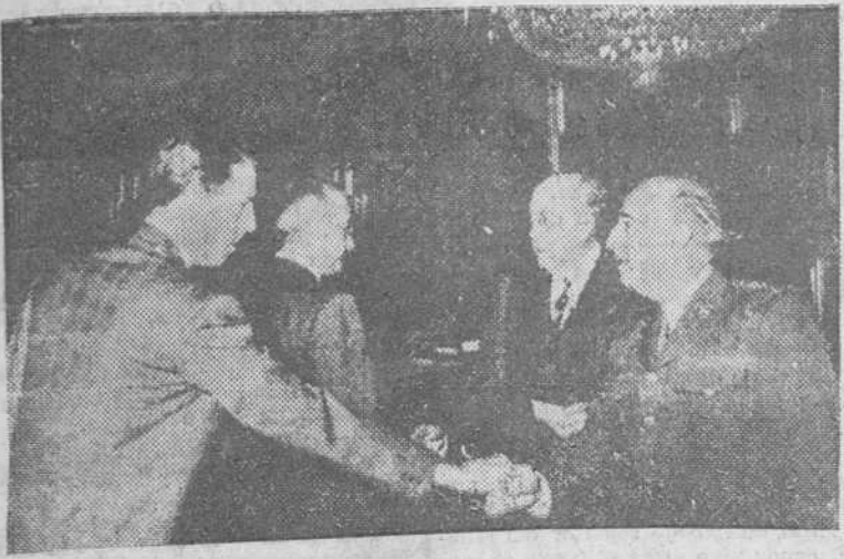
Madrid.—Los miembros que integran la Comisión de parlamentarios norteamericanos, presididos por el embajador de los Estados Unidos, Mr. Stanton Griffiths, que fueron recibidos por Su Excelencia el Jefe del Estado en su despacho del Palacio de El Pardo.