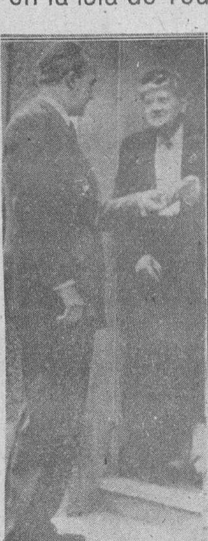
Isle de Yeu. — Mme. Petain y su hijo, esperan la llegada del coche que les trasladará al fuerte de Pierre Levee...