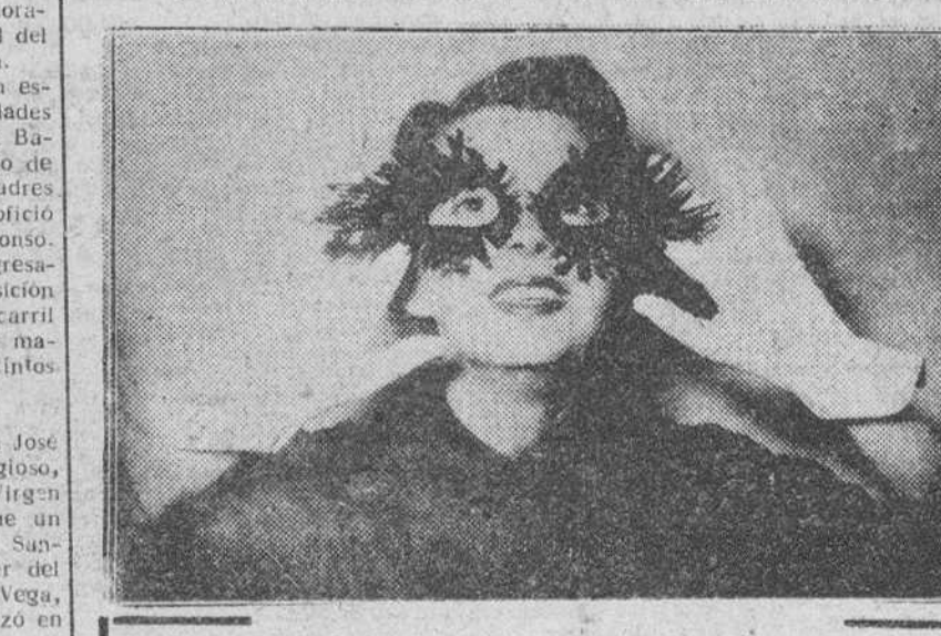
LA MODA DE PARIS APUNTA ESTE AÑO MAS EXTRAVAGANCIAS QUE NUNCA. VEAN ESTE NUEVO MODELO DE GAFAS PARA LOS BARON DE SCL, IDEADAS POR SCHIAPARELLI, PARA PROTEGER LOS OJOS DE LAS ELEGANTES.