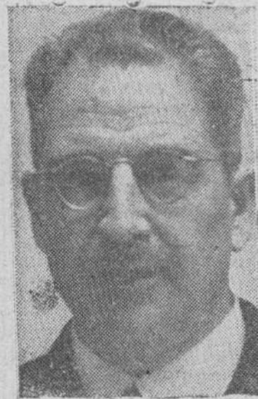
Madrid. -- En el Círculo de la Unión Mercantil se ha celebrado esta tarde un homenaje al Ayuntamiento de Burgos y al presidente de su Círculo de la Unión como recuerdo de gratitud a la generosa hospitalidad que le fue dispensada al Círculo de la Unión Mercantil de Madrid y sus socios en la capital castellana durante la gloriosa cruzada nacional.

La figura del Cardenal Benlloch, íntimamente vinculada al recuerdo de los burgaleses que, por conocerle, supieron venerarle y admirarle, quiere hoy DIARIO DE BURGOS traerla a la consideración de sus lectores, a quienes pide una oración por el eterno descanso del alma de quien supo ser, preclaro Príncipe de la Iglesia, insigne Arzobispo burgalés y adelantado de las más nobles aspiraciones de este Burgos al que tanto amó Su Eminencia.